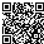
動画閲覧はこちら