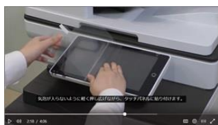
抗菌フィルム貼付手順動画